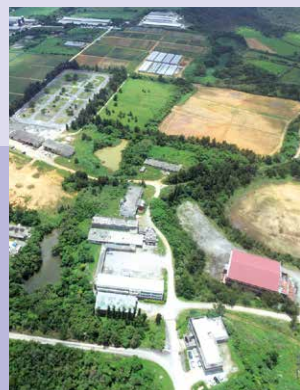
(一社)沖縄産業開発青年協会

足場を組む とび 「薦工」、鉄筋を組む「鉄筋工」、コンクリートを流し込むための枠を建込む「型枠工」。これら3職種の基礎的スキルを学び、建設現場で必要な車両系建設機械の資格(整地・運搬・積込・掘削用)ならびに、解体の資格が取得できるコースです。